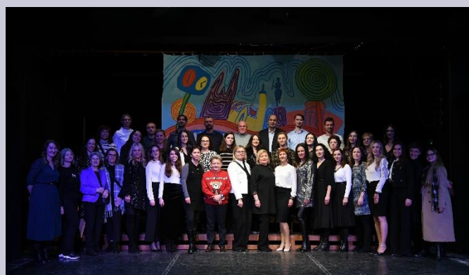
Bivši i sadašnji djelatnici Osnovne škole Ljubljana