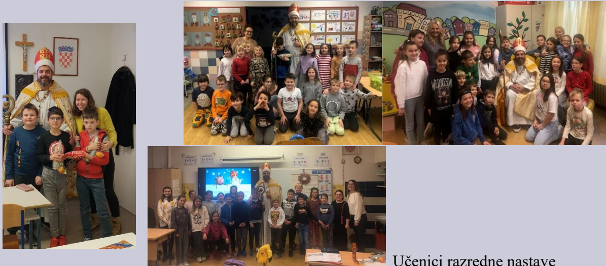
Učenici razredne nastave